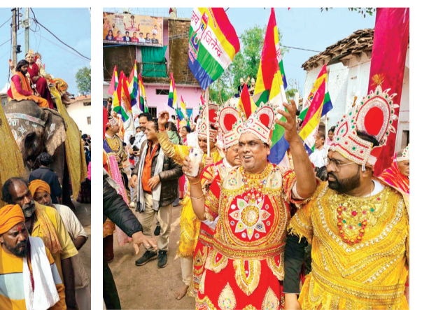
हरिभूमि न्यूज अशोकनगर

वहों दूसरे हाथों पर कुबेर रत्नों की वर्षा करते हुए चल रहे थे। आगे आगे युवा नृत्य करते हुए चल रही थी वहीं महिलाएं मंगल गीत गाते हुए चल रही थीं, युवा हाथों में धर्म ध्वजा लहराते हुए चल रहे थे। इस दौरान श्रद्धालुओं ने जमकर नृत्य किया। शोभा यात्रा का शुभारंभ राजपुर रोड पंचकल्याणक महोत्सव स्थल से हुआ जो मेन रोड से निकलकर जैन मंदिर होते पहुंची आदिकुमार का बताया जन्म चित्रण कार्यक्रम में इस दौरान आदिकुमार के जन्म का चित्रण बताया गया। जहां राजा नाभिराय का दरबार सजा, इंद्र इंद्राणी राजा नाभिराय से मिलने पहुंचे। इंद्राणी बालक आदि कुमार को उठाकर लाई। शोभा यात्रा में ग्रामीणों ने जगह-जगह पुष्प वर्षा की और लड्डू बाटकर समाज जनों का स्वागत किया।